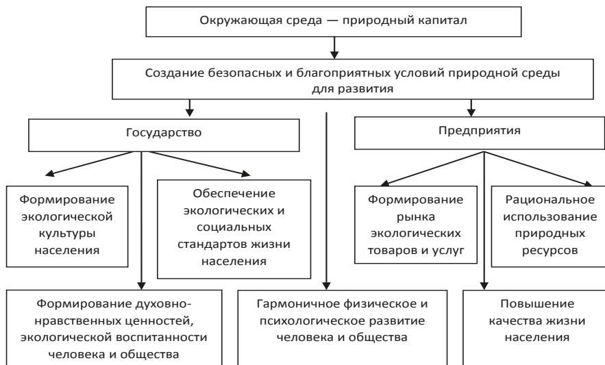
Рис. 1. Влияние состояния окружающей среды на формирование человеческого капитала