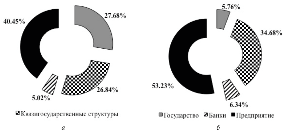
Рис. 2. Распределение суммарных выгод (а) и затрат (б) между участниками ГЧП в рамках проекта производства нанокерамики, реализуемого ЗАО «НЭВЗ-КЕРАМИКС»

Соответствующее распределение суммарных выгод и затрат всех участников ГЧП между выгодами и затратами отдельных групп партнеров представлено на рис. 2).