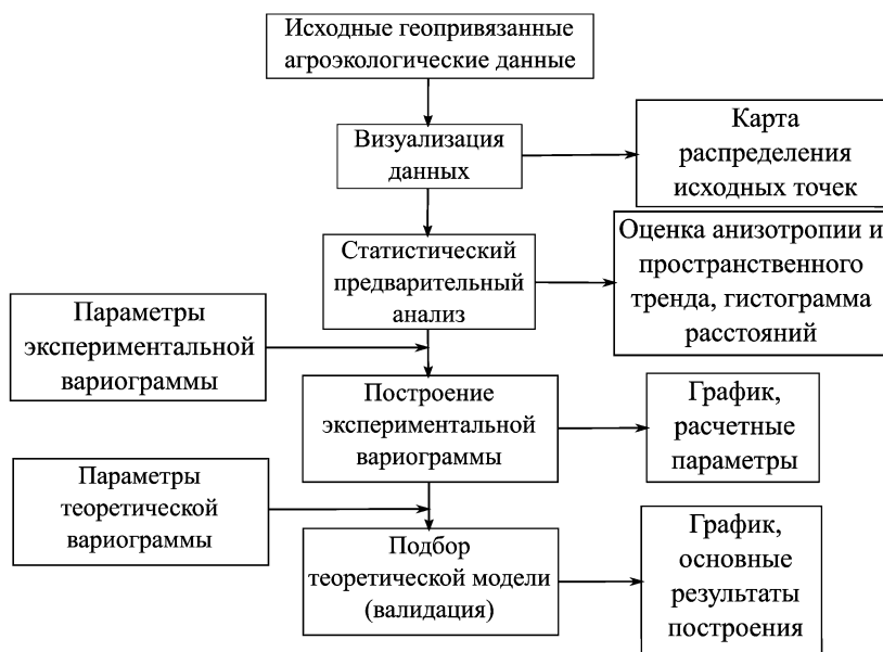
Рис. 2. Общий алгоритм автоматизации вариограммного анализа

подходы, выделяются две основные проблемы: либо расчеты чрезмерно упрощены для пользователя, соответственно упускается часть важных статистических проверок и результатов, либо применение средств автоматизации требует от пользователя глубоких экспертных знаний. Данный модуль от существующих аналогов отличает ряд особенностей: на каждом этапе построений рассчитываются оптимальные параметры для дальнейшего анализа, пользователь может согласиться применять предложенные программой либо ввести свои показатели; полученные результаты могут быть напрямую автоматически применены для решения определенной задачи ТЗ (например, выдать заключение о целесообразности перехода к дифференцированным технологиям на конкретном сельскохозяйственном поле на основе вычисленной нагетт-дисперсии).