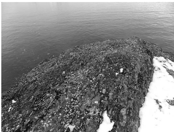
Рис. 6. Пример типичной «чайчьей скалы» — скала-отторженец Капля, о. Галиндез, популяция № 37, 15.03.2014 г.

Однако в ходе инвентаризации было показано также наличие популяций, находящихся за пределами гнездовой и пищевой территории чайки. Их образование может быть объяснено с несколькими причинами.