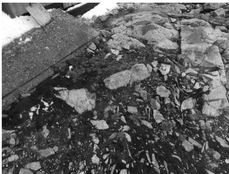
Рис. 8. Популяция щучки № 9 у порога павильона аэронавтики может иметь антропогенное происхождение, о. Галиндез, 28.02.2014 г.