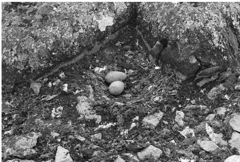
Рис. 7. Небольшие побеги D. antarctica в гнезде южнополярного поморника, о. Галиндез, 25.01.14 г.