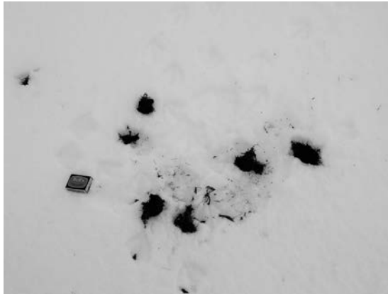
Рис. 3. Следы добычи гнездового материала (побегов Sanionia) из-под снега, о. Галиндез, 17.11.2007 г.

Аргентинские острова невысоки и во время последнего ледникового максимума вероятно были покрыты шельфовым ледником [14, 15]. Можно предположить, что первичная колонизация данных островов (прежде всего наиболее рано обнажившихся из-под ледников участков северного побережья острова) после дегляциации связана с переносом щучки и других растений чайкой. Такой перенос мог быть осуществлен из более высоких и, возможно, расположенных над ледником прибрежных участков Антарктического полуострова и крупных островов [16]. Значительная часть современных локалитетов имеет орнитогенное происхождение. В связи с ранним гнездованием (в зависимости от метеоусловий птицы начинают строить гнезда в октябре-ноябре, а откладывать яйца в конце ноября) чайки вынуждены отыскивать участки, которые первыми освобождаются из под снега и собирать там в первую очередь побеги мхов Sanionia , а также D. antarctica . В неблагоприятных случаях птицы могут добывать гнездовой материал даже из-под снега (рис. 3).