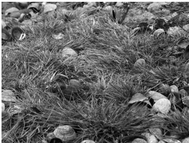
Рис. 4. Локальное уплотнение D. antarctica в месте бывшего гнезда доминиканской чайки, о. Галиндез, популяция № 37, скала-отторженец Капля, 15.03.2014 г.

вышеуказанных островах-скалах, в сезон 2013/14 гг. большинство популяций исчезло. В тех популяциях, которые уцелели, численность щучки резко сократилась. В то же время часть популяций, по-видимому, успешно приживается. При этом в современных многочисленных популяциях D. antarctica участки максимальной плотности щучки — 100%, вероятно, соответствуют бывшим гнездам чаек (рис. 4).