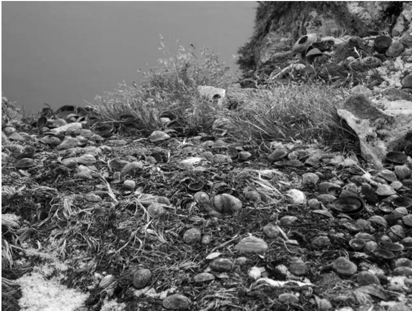
Рис. 2. Гнездо доминиканской чайки, окруженное растениями D. antarctica , о. Галиндез, популяция № 22, 19.03.2014 г.

В ходе данного исследования в сезон 2013/14 гг. было выполнено полное картирование локалитетов D. antarctica о-ва Галиндез (за исключением наиболее рано обнажившегося из-под ледника так называемого небольшого п-ва Крачек в юго-западной части острова, где поблизости от ежегодно функционирующего гнезда чайки в сезон 2009/10 гг. закрепилось 3 растения щучки). Картирование осуществлялось с помощью ручного GPS-навигатора Garmin Etrex. Под локалитетом мы понимали обособленное местопроизрастание вида. Локалитеты, в свою очередь, были двух типов: представленные популяциями (группой экземпляров вида, пространственно изолированных особенностями рельефа от других локалитетов) и единичными особями. Всего зафиксировано 67 локалитетов. В каждом из них изучались численность растений и отдаленность от моря. При этом нами анализировались данные о пространственном распределении гнезд доминиканской чайки и южнополярного поморника в сезоны 2007/08, 2008/09, 2009/10, 2011/12, 2012/13, 2013/14 гг. Кроме этого отмечалось наличие вблизи популяции D. antarctica следов кормления доминиканской чайки, которые можно легко определить по залежам ракушек антарктического моллюска Nacella concinna — одного из главных кормов данной птицы [11] (рис. 2).