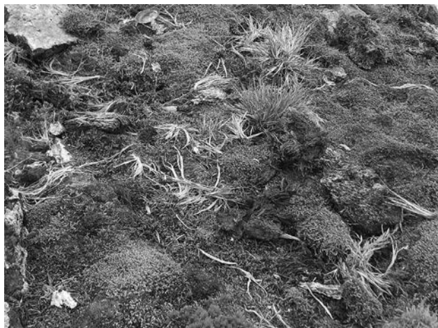
Рис. 5. Следы выдергивания доминиканской чайкой побегов щучки во время гнездобастроительного сезона, о. Галиндез, популяция № 61, скала Дракона в районе Якорной бухты, 23.02.2014 г.