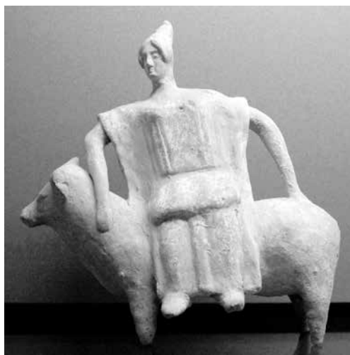
Рис. 2. Терракотовая фигурка из Беотии. 470–450 г. до н.э. Лувр