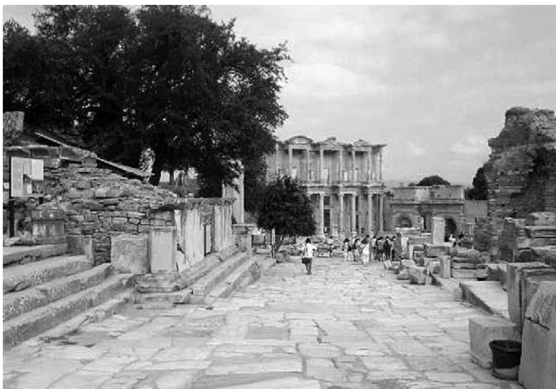
Рис. 3. Здание библиотеки. Город Эфес

город уже далеко от побережья.) Но многое в этих городах не раскрыто, ко многому надо приложить руки и вложить деньги. В данный момент это выглядит так, словно Европу выкрали и вернули в Малую Азию, но что делать с ней, кроме как увеличивать туристическую привлекательность, еще не придумали.